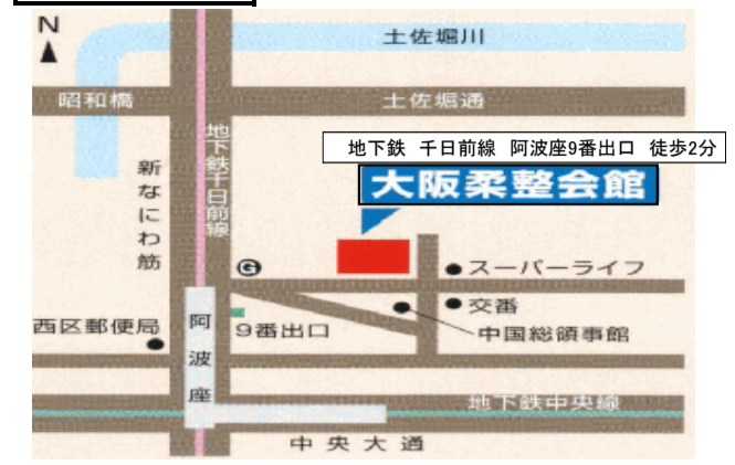
近畿・大阪ブロック会場地図