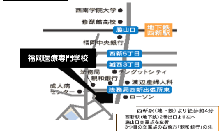
九州ブロック会場地図