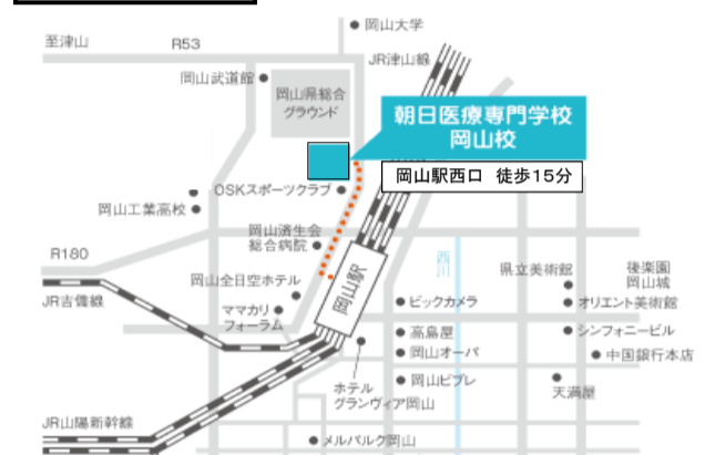
中国・四国ブロック会場地図