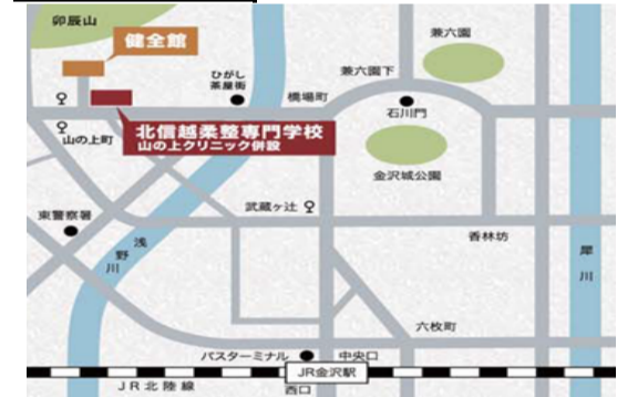
北信越ブロック会場地図

JR金沢駅バスターミナルより 【JRバスをご利用の場合】 「森本」「才田」「福光」「加賀二俣」行きに乗車。「山の上町」下車。 所要時間: 約10分 下車後徒歩3分 【北陸鉄道バスをご利用の場合】 「武蔵ヶ辻」のバスに乗車。「武蔵ヶ辻」で乗り換え「東金沢」「柳橋」行きに乗車。 「山の上町」下車。 所要時間: 約15分 下車後徒歩3分