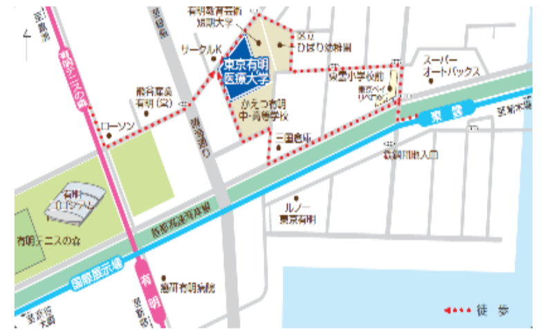
関東・東京ブロック会場地図