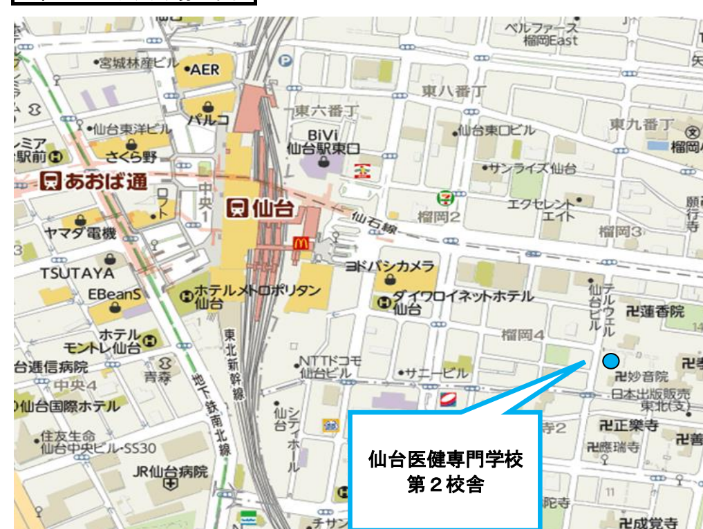
東北ブロック会場地図