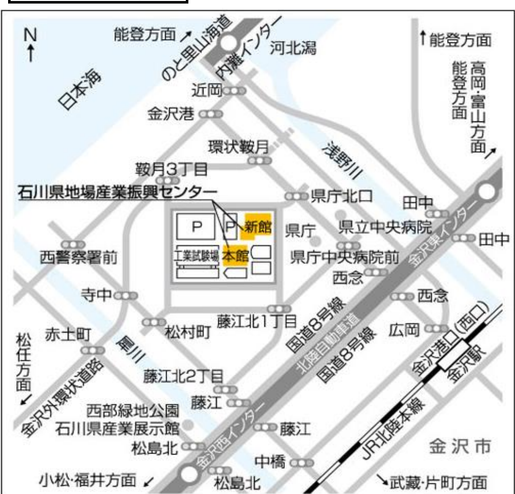
北信越ブロック会場地図