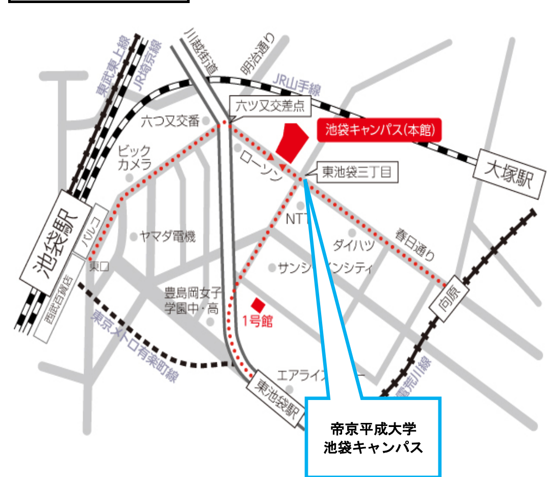
関東・東京ブロック会場地図

* 10月1日(日)と11月12日(日)の時間割が一部変更になりましたが上記の通り開催します。